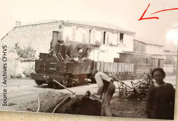
Photo prise à Vauécourt dans les années 1880. En tête de rame, une locomotive « Péteau », les premières locomotives qui ont roulé sur la ligne Hairoville-Triaucourt, avant l'arrivée des « Corpet »... et de Suzanne.

Retour à notre ligne ! Celle-ci empruntait la route sur une centaine de mètres avant d'arriver à son prochain arrêt : la gare de Vaubecourt !